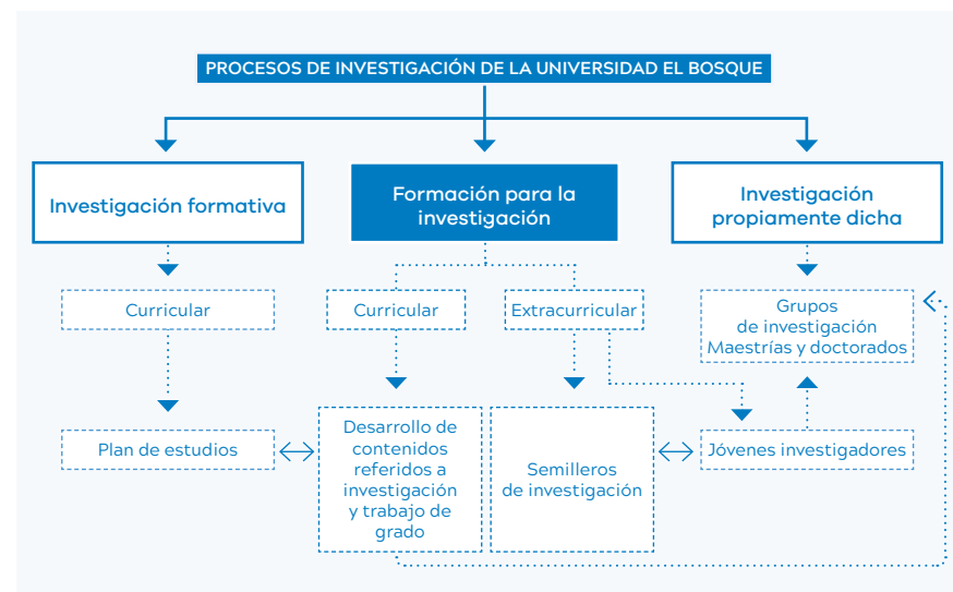
Figura 1. Escenarios académicos de investigación

De acuerdo con los conceptos expuestos, esquemáticamente, la investigación en la Universidad El Bosque se ha dividido en tres escenarios académicos: investigación formativa, formación para la investigación e investigación propiamente dicha, los cuales configuran un proceso continuo para fortalecer las actividades científicas de la institución (véase figura 1).